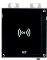
2N® ACCESS UNIT 2.0 RFID ord. 9160334 9160334-S (zabezpečená)