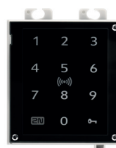
2N® ACCESS UNIT 2.0 TOUCH KEYPAD & RFID ord. 9160336 9160336-S (zabezpečená)