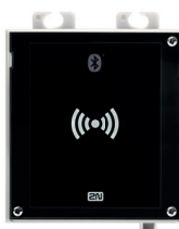
2N® ACCESS UNIT 2.0 BLUETOOTH & RFID ord. 9160335 9160335-S (zabezpečená)